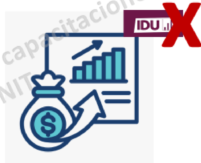
Las rentas y ganancias del capital, excluidas las gravadas por el IDU.