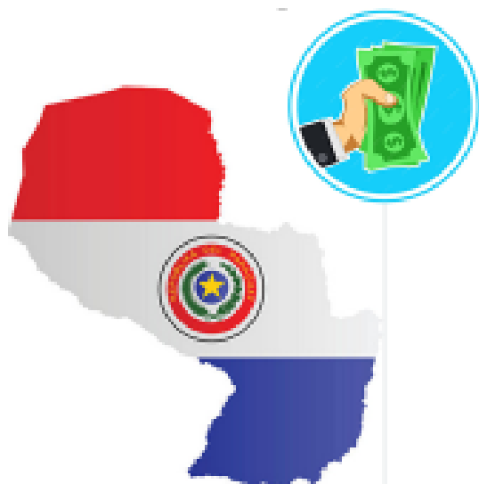
Rentas de fuente paraguaya