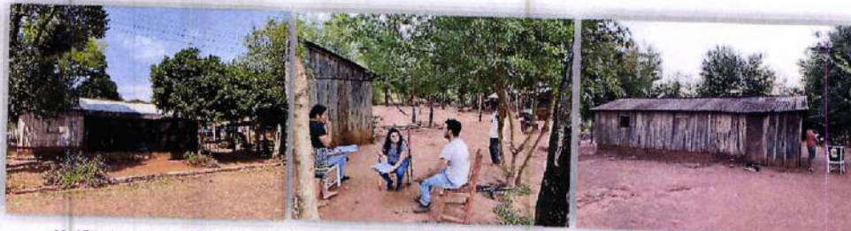
Verificaciones del domicilio fiscal declarado por los contribuyentes vinculados al esquema de facturas de contenido falso.

Estos logros reflejan el fortalecimiento de las capacidades analíticas y operativas de la DNIT en materia de inteligencia fiscal, así como su compromiso con una gestión tributaria más eficiente, preventiva y alineada con estándares internacionales.